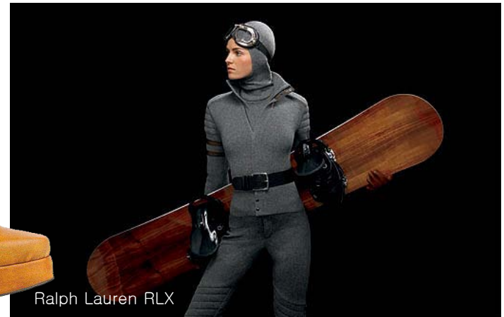
Ralph Lauren RLX