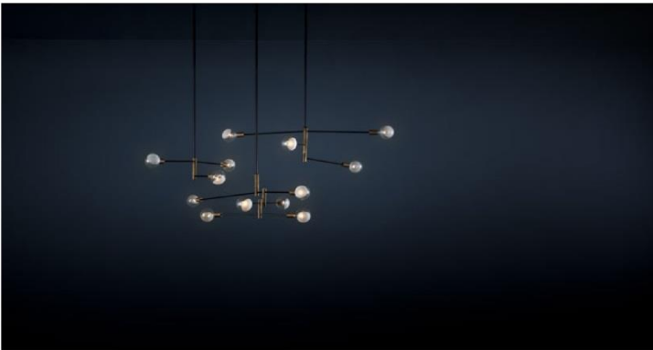
LAMPADA 047 / PARAVENTO 055 / Surrealistic Interior Concept Map

Emiliano Salci(에밀리아노 살시)와 Britt Moran(브리트 모란)이 설립한 디자인 스튜디오 디모어. 아트 디렉터와 그래픽 디자이너인 이들은 상하이 호텔 프로젝트 진행을 통해 Dimore Studio라는 이름 아래 서로 협업하기 시작했다. 빛과 어둠, 부드러움과 강인함 등의 대비되는 요소들 사이의 균형을 맞추며 인상적인 공간을 디자인한다. 독자적인 디자인 컨셉을 고수하면서, 따뜻함과 친숙함, 기능성을 부각시킨 모던한 디자인으로 주목 받고 있으며, 보테가 베네타와 에르메스 매장의 인테리어 디자인을 맡기도 했다. 디자이너들이 가장 선호하는 프로젝트는 파리에서 처음 맡았던 Café Burlot (카페 부를로). 야자수가 그려진 벽지와 동양적인 분위기의 소품을 매치하여 이국적인 분위기로 연출했다.