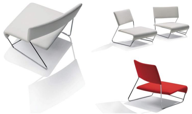
Twis low chair, Felicerossi 2007