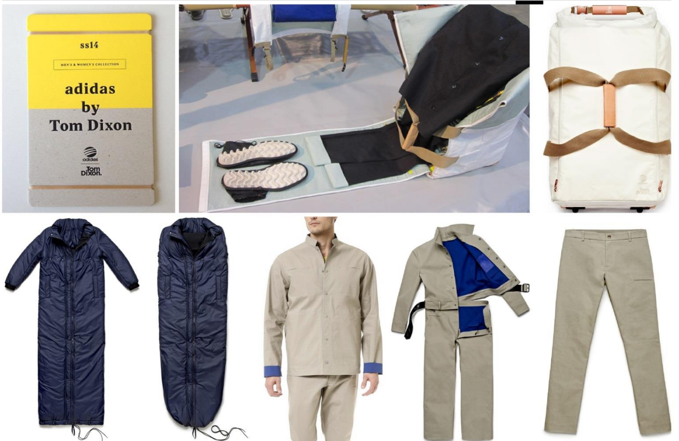
Adidas x Tom Dixon 14S/S Capsule Collection

디자이너 자신이 밀라노에서 목을 곳을 찾지 못해 공원에서 노숙해야 했던 경험에서 영감을 얻었다고 한다. 침낭으로 변하는 점퍼, 모듈 방식으로 코트, 재킷, 바지, 스커트 쇼츠로 변환 및 분리가 가능한 5 in 1 오버롤까지 혁신성이 돋보이는 아이템들은 스포츠 및 기능성 웨어에 유용하게 적용될 것이다.