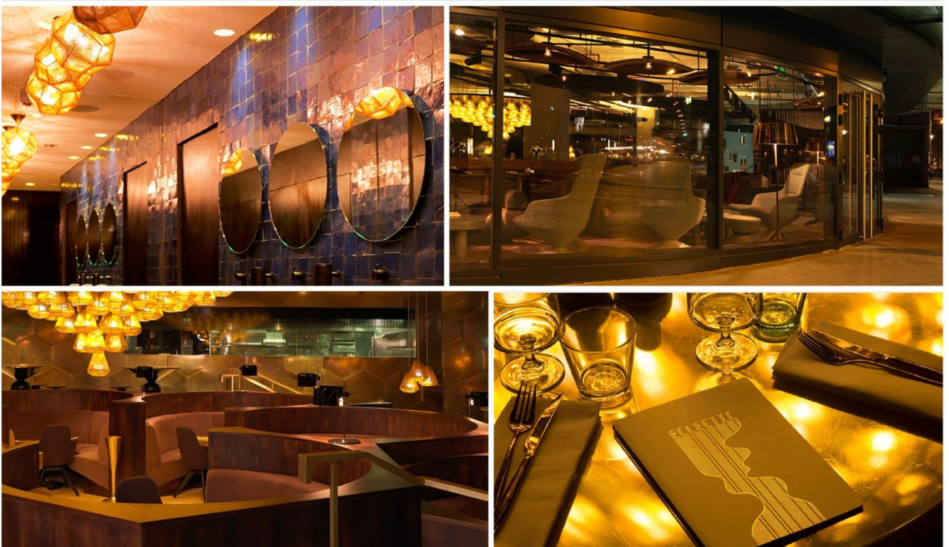
Eclectic Restaurant, Paris

톰 디kson은 최근 오픈한 Eclectic Restaurant의 인테리어 디자인을 담당했다. 파리에서는 처음으로 그가 디자인한 공간을 선보이는 곳이기도 하다. 반복되는 육각 패널의 별집 구조 벽면과 Copper, 가죽 소재를 사용하여 모던하면서도 따뜻한 느낌의 인테리어를 선보였다. 이 곳은 파리 15구에 위치한 대형 쇼핑몰인 브그르넬 1층에 위치하고 있는데, 편안하고 안락한 인테리어로 쇼핑몰을 오가면서 고객들이 편안하게 쉴 수 있는 휴식 공간 역할을 할 것으로 기대된다