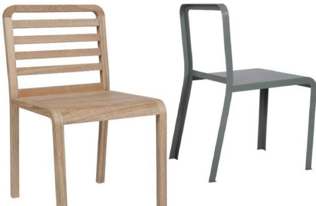
Twin Chairs VIA grants 2009