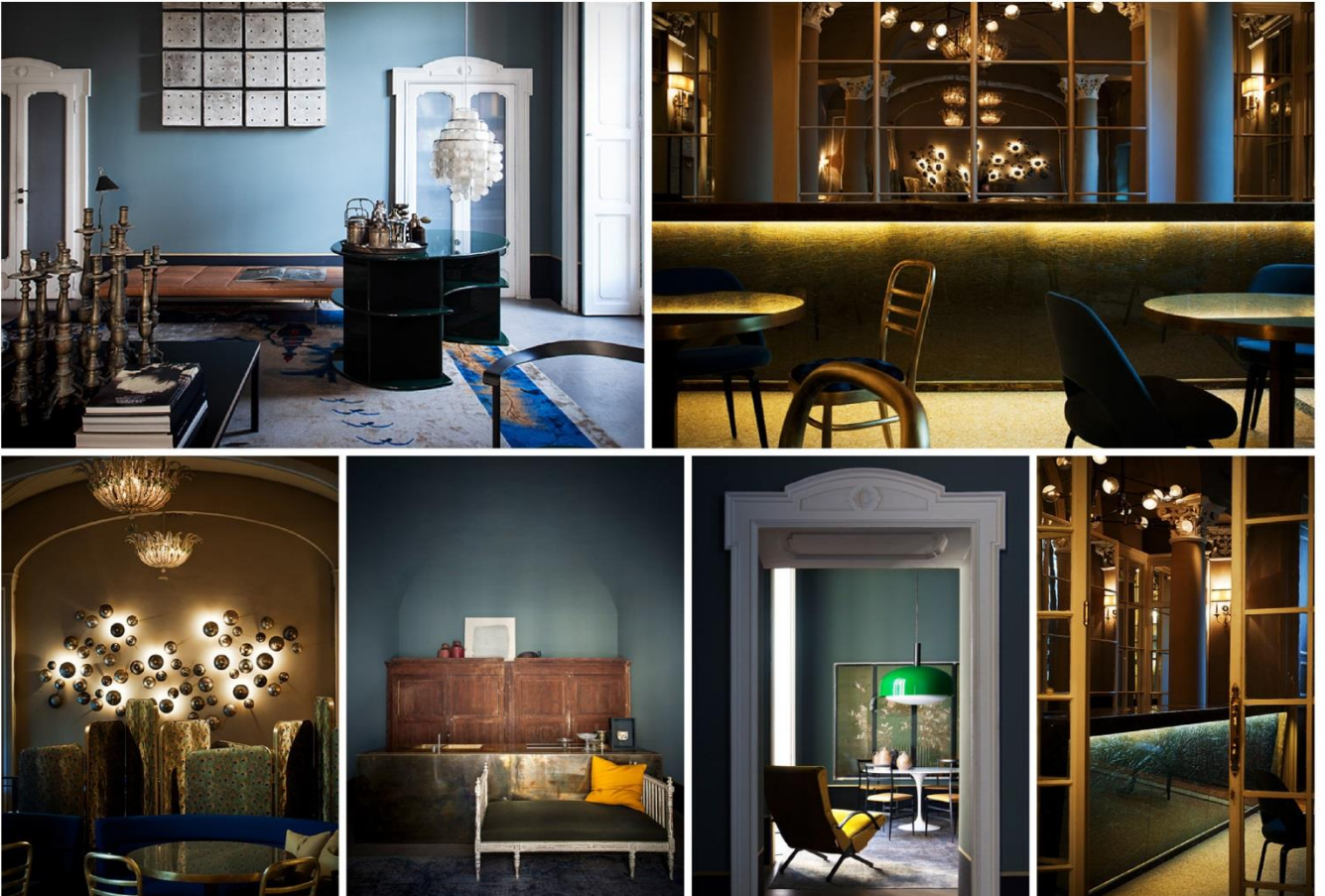
Restaurant Caruso, Milan / Residential Interior Design, Milan

특히 주거 공간을 디자인할 때에는 공간 주인만의 독특한 개성과 어우러지는 디자인으로 소비자에게 맞춤형 공간을 디자인하여 차별화를 추구하면서도 따뜻하고 안락한 공간을 창조해내고 있다. 대표적인 작품으로 밀라노에 위치한 레스토랑 카루소는 다양한 조명과 거울을 통해 빛과 그림자의 대비 효과를 부각시키고 있다. 또한 밀라노에 위치한 레지던스의 인테리어는 마치 갤러리와 같은 공간을 조성하면서도 빈티지한 가구들로 편안하고 따뜻한 공간 분위기를 강조하고 있다.