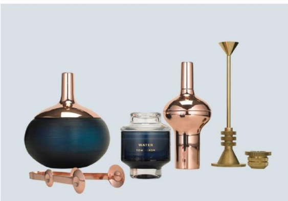
2014 Living Accessories Collection