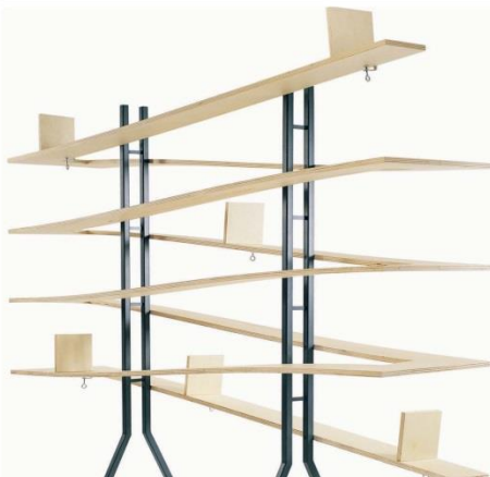
Spiral Shelf (2005)