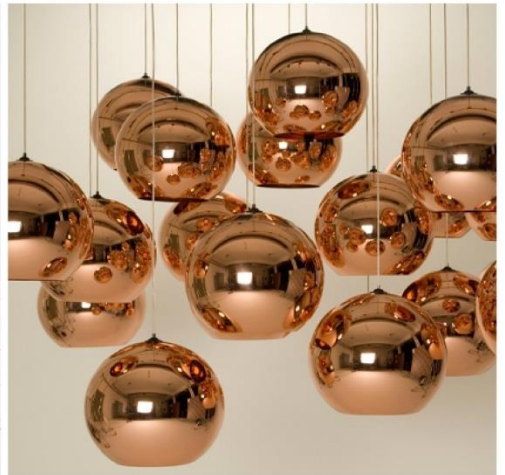
Copper Shade (2005)