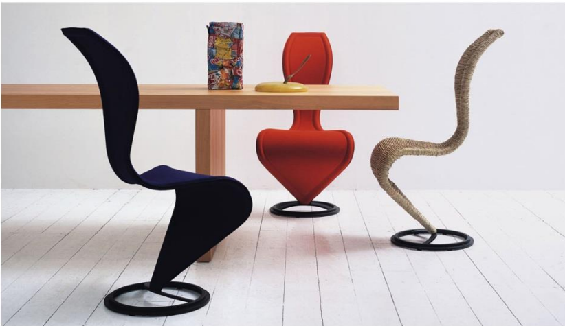
S Chair (1987)