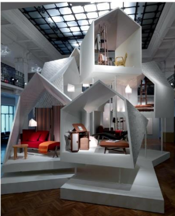
Les Nécessaires d'Hermès 컬렉션

필립 니그로는 2013년 패션 브랜드 에르메스와의 협업을 통해 풍성해진 홈 컬렉션을 제안했다. 패션과 결합한 8가지 캡슐 퍼니처 컬렉션을 선보였으며, 2013년 밀라노 국제 가구 박람회에서도 첫 선을 보여 화제를 모았다. 에르메스의 고급스러움과 필립 니그로만의 모듈과 조합, 기능성을 살린 구조적인 디자인이 만나 실용성이 돋보이는 우아한 가구 컬렉션을 선보였다. 수납장, 파티션, 의자, 테이블 웨어를 디자인하였으며, 새롭게 선보인 다양한 패턴의 벽지와 패브릭은 말, 동물, 식물 바다 등의 에르메스 시그니처 테마를 활용했다. 에르메스의 특화된 부드러운 가죽 소재와 패브릭, 가죽 공예 기술을 적용하고, 고급 수종인 월넛과 Brass 철물을 사용하여 심플하면서도 우아함을 표현하는 컬렉션을 선보였다.