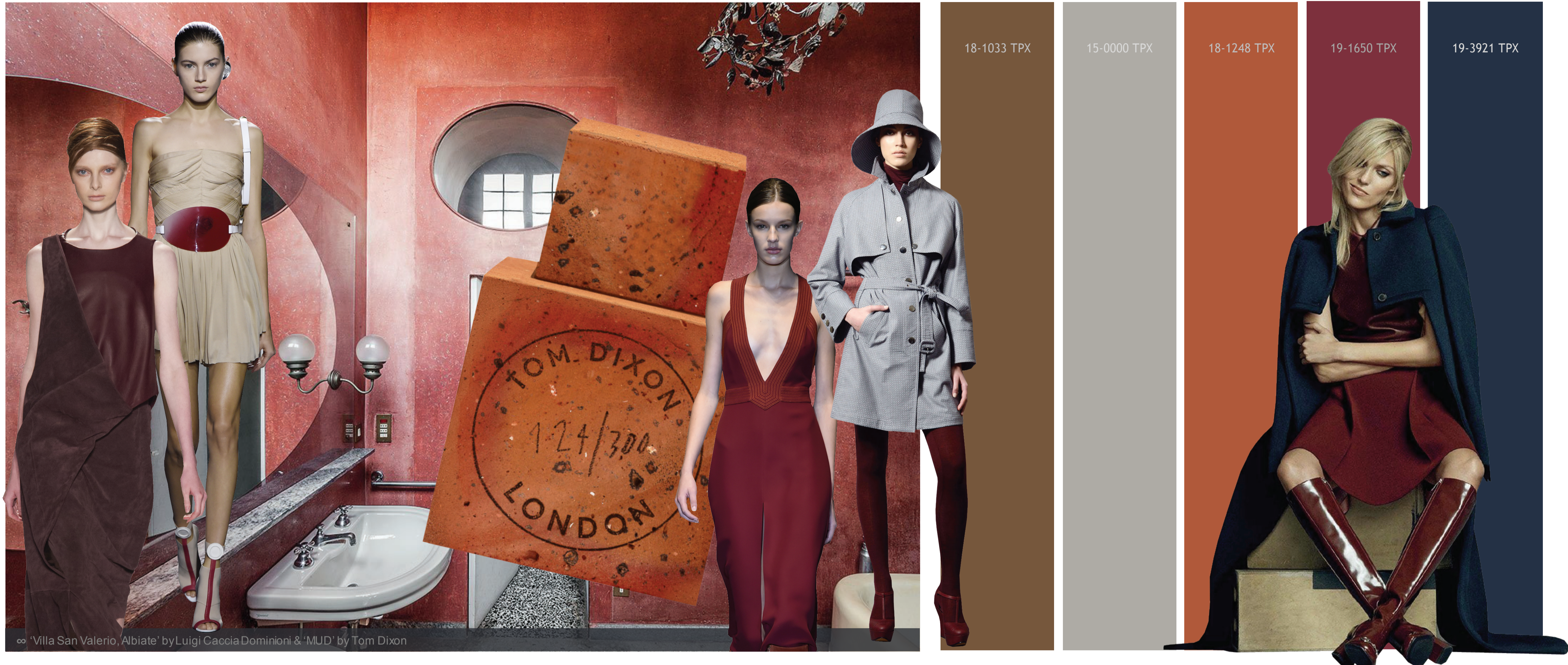
∞ 'Villa San Valerio, Albiate' by Luigi Caccia Dominioni & 'MUD' by Tom Dixon