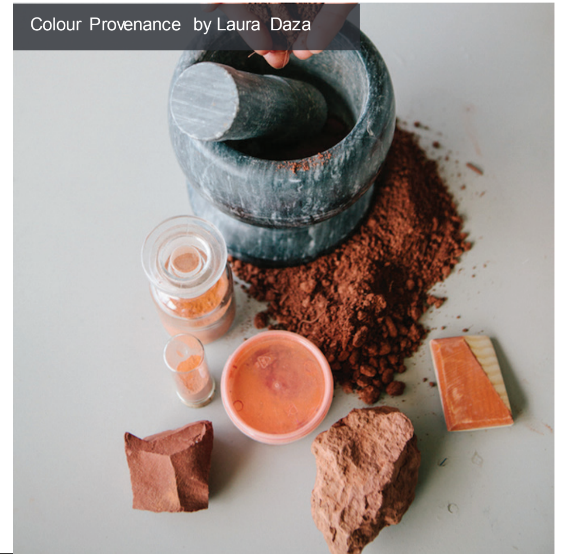
Colour Provenance by Laura Daza