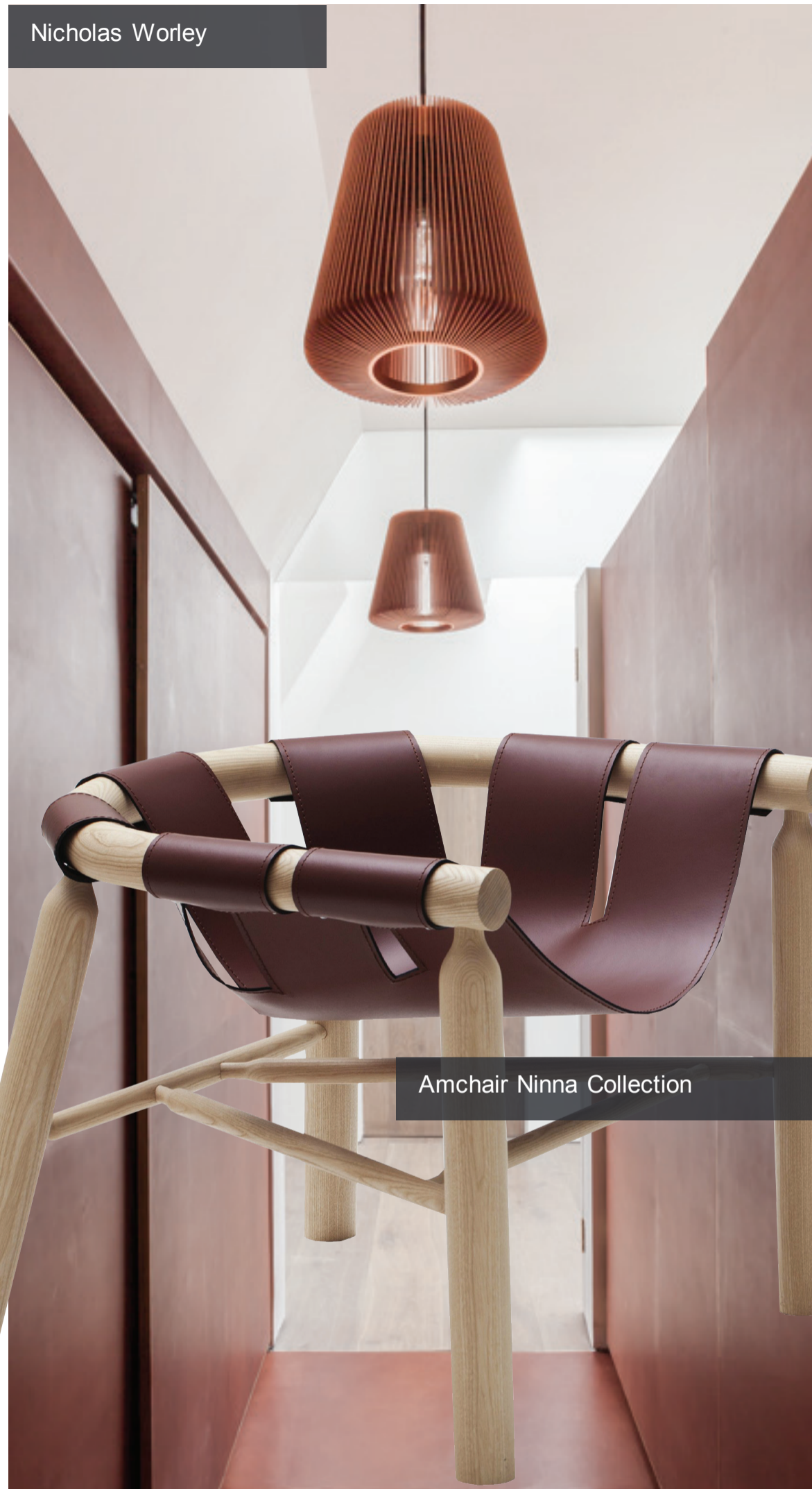
Amchair Ninna Collection