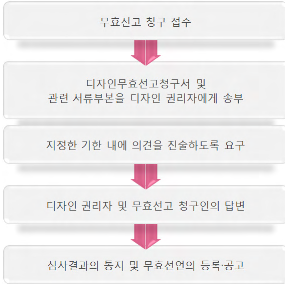
[그림 2-10] 디자인 무효선고청구 심사절차