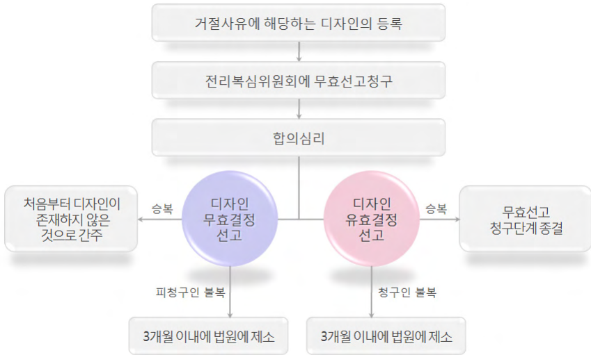
[그림 2-9] 디자인 무효선고 청구절차

중국 기업에 의해 우리 기업의 도용된 디자인이 중국내에서 선등록된 경우 디자인무효선고 청구제도를 이용할 수 있다. 그러므로 중국 기업에 의하여 디자인이 선등록된 경우 디자인출원·등록을 포기하기보다는 디자인무효선고 청구제도를 적극적으로 활용하는 것이 바람직하다.