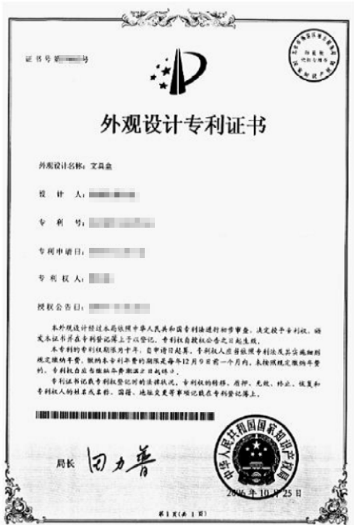
[그림 2-7] 디자인등록증