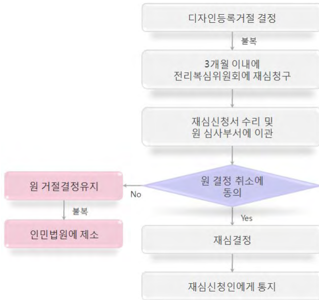
[그림 2-8] 디자인등록 거절결정에 대한 불복 절차

국무원 전리행정부서가 디자인등록거절결정을 내렸을 경우 이용할 수 있는 제도가 디자인등록거절결정에 대한 재심청구제도이다. 디자인등록 거절시 신청인은 이 제도를 활용하여 국무원 전리행정부서의 전리복심위원회에 재심청구를 함으로써 디자인 권리를 취득할 수 있다.